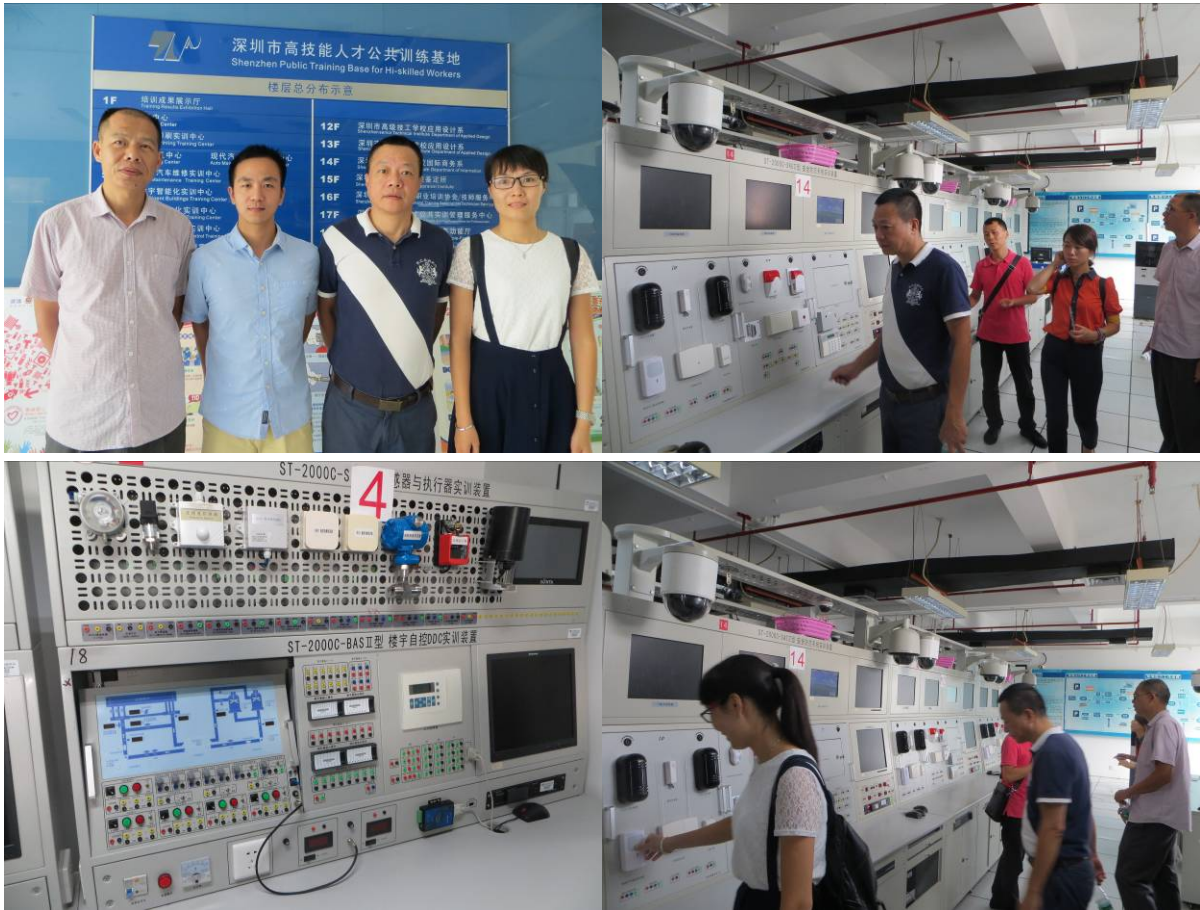
(上图)深圳市高技能人才公共实训管理服务中心实训车间留影