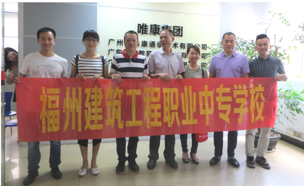
(上图)我校老师在广州市唯康通信技术有限公司留影