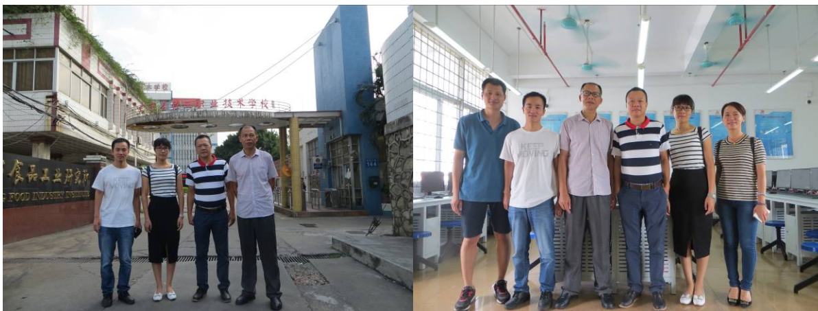
(上图)我校老师与广东省轻工职业技术学校老师在实训室合影