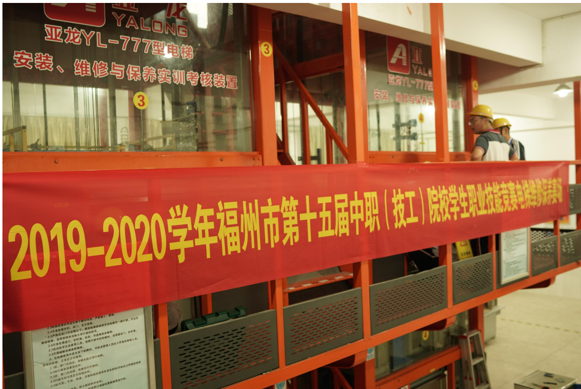
电梯安装与维护赛场