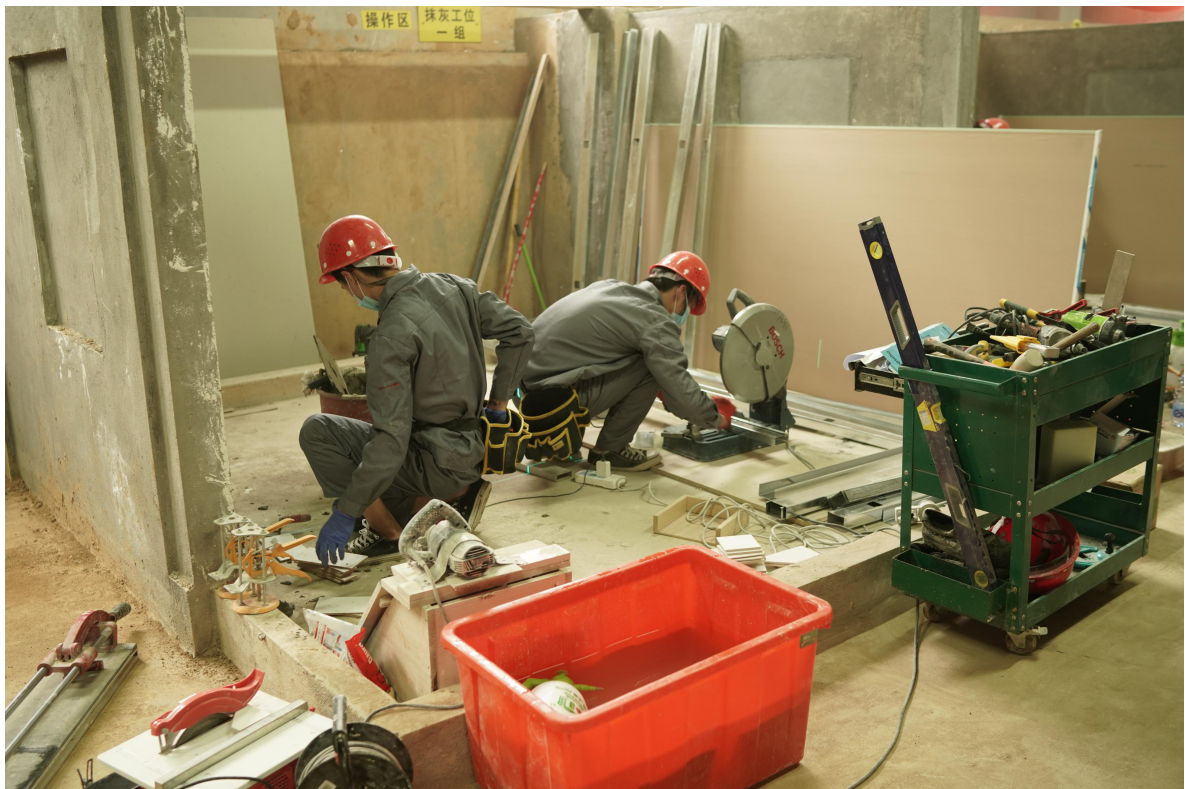
建筑装饰技能赛场