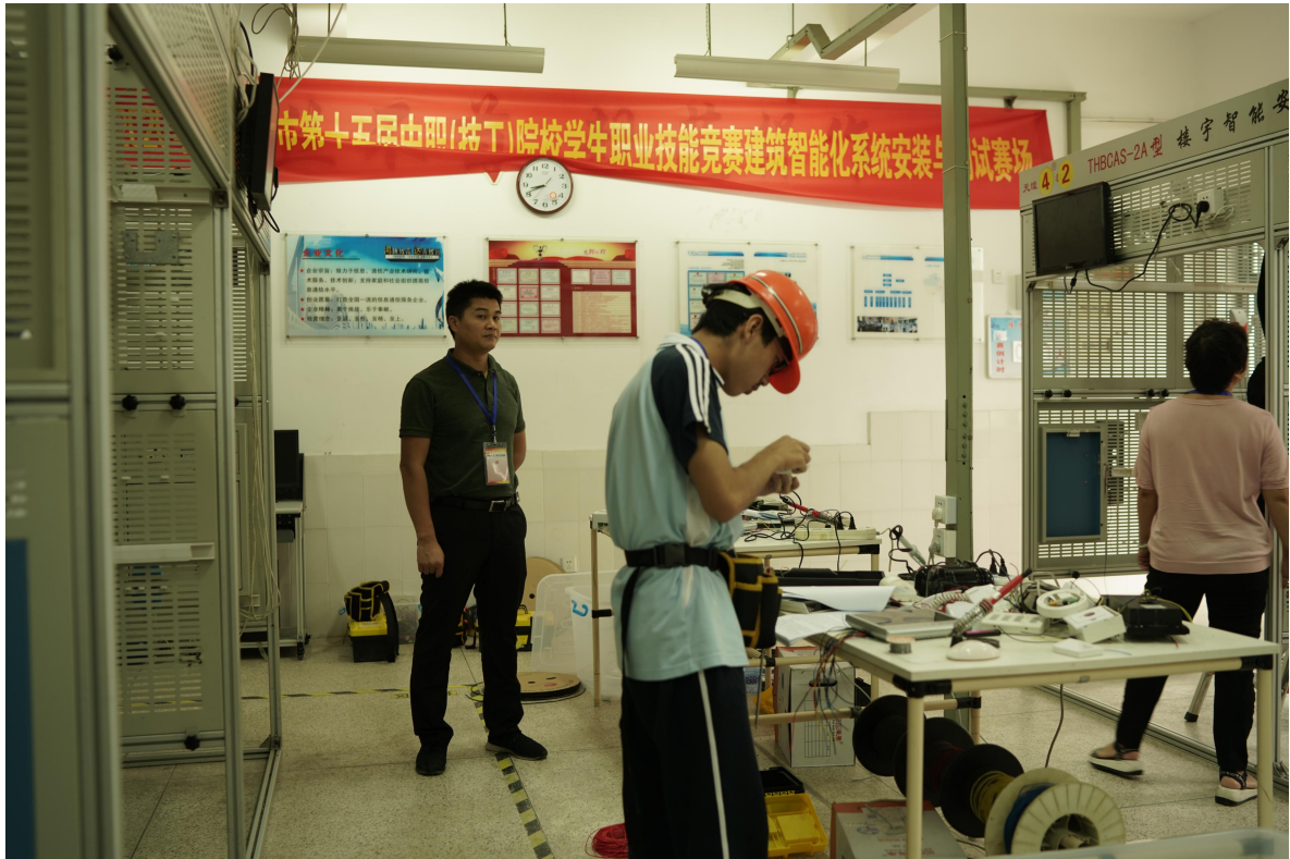
建筑智能化系统安装与调试赛场