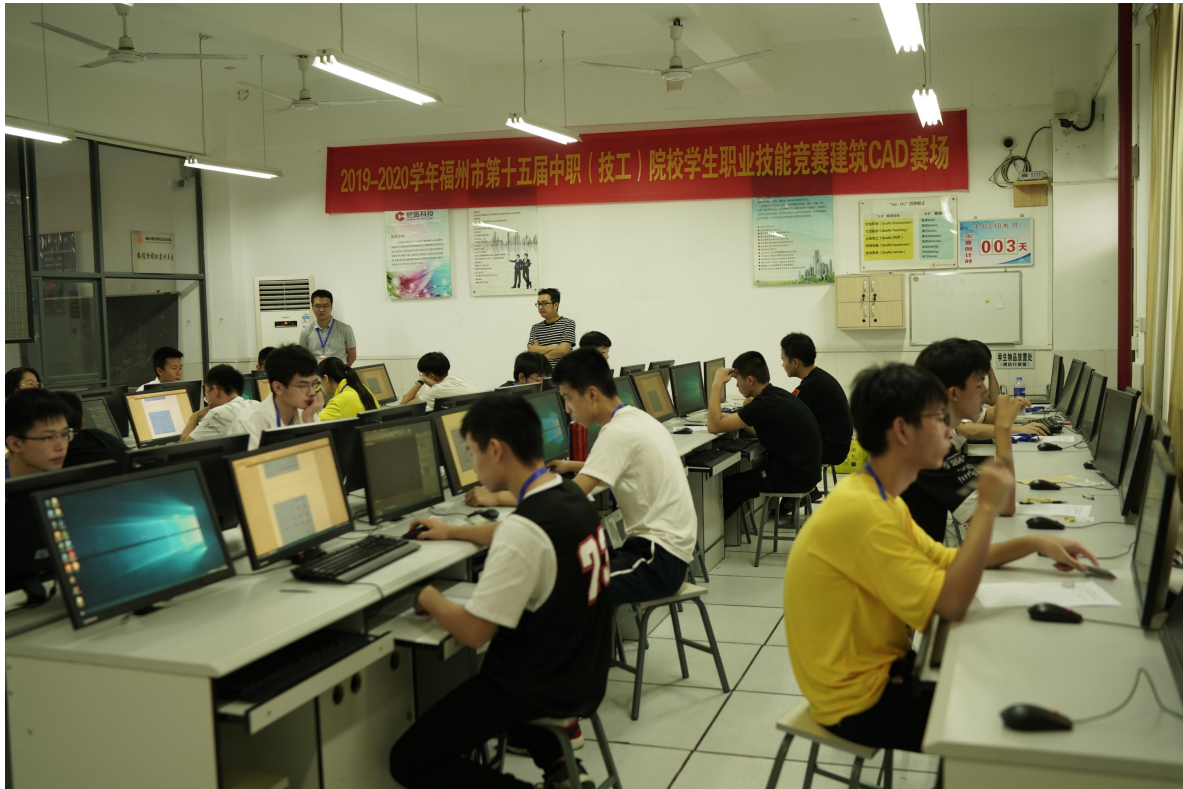
建筑 CAD 赛场