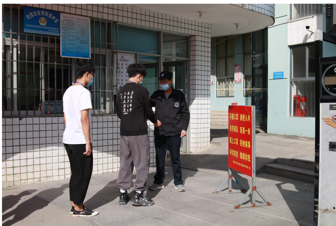
选手进入赛场测温检查

此次竞赛时值新冠肺炎常态化疫情防控时期，在上级主管部门和防疫部门的指导下，赛点严格做好新冠肺炎疫情防控工作，参赛选手和工作人员进入赛场经过严格的测温检查，比赛现场增配安保人员和医务人员，组织志愿服务队，制定疫情防控应急预案，确保比赛顺利进行。