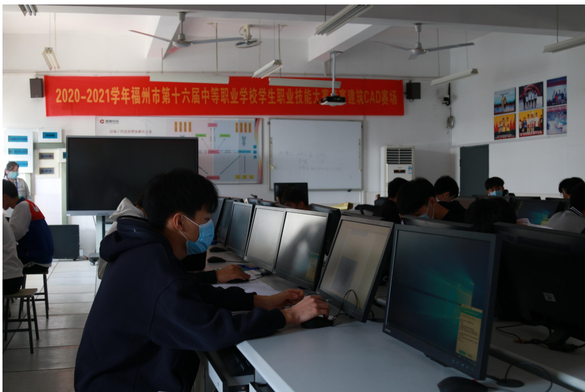
建筑 CAD 赛场