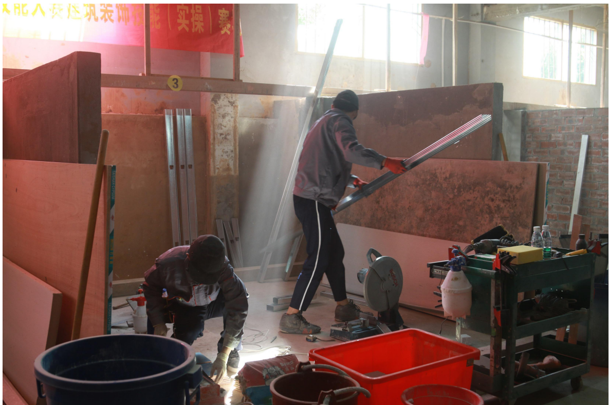
建筑装饰技能赛场