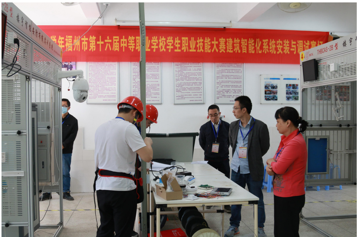
建筑智能化系统安装与调试赛场