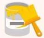
废油漆 及废油漆桶