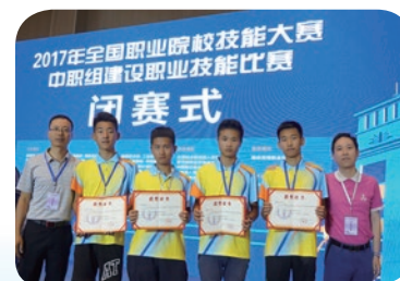
2017年全国职业院校技能大赛： 工程测量二等奖