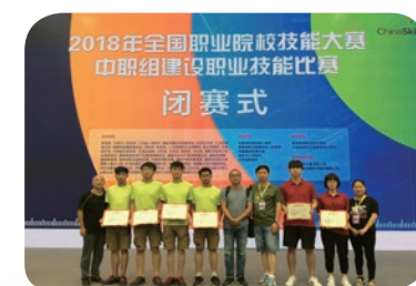
2018年国赛二等奖、三等奖： 工程测量、建筑CAD