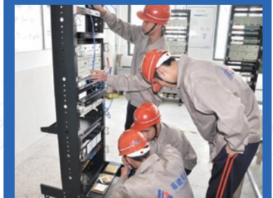
电梯安装与维修保养专业