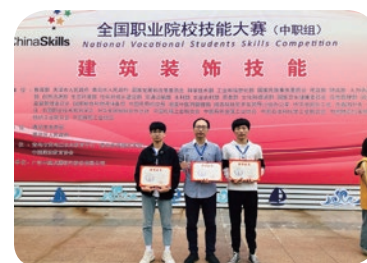
2019年全国职业院校技能大赛： 建筑装饰一等奖