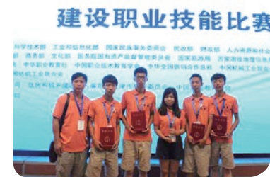
2014年全国技能竞赛： 工程测量一等奖