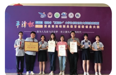
2018年第二届中华职业教育创新创业大赛国赛银奖