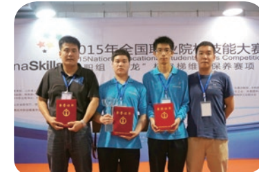
2015年全国、福建省职业院校技能大赛： 电梯维修保养项目一等奖