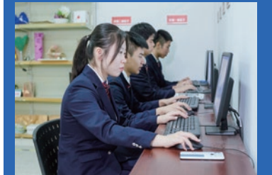
建筑装饰技术专业

毕业后主要在建筑公司、装饰公司、建筑及装饰设计单位、房地产等单位从事建筑装饰设计、绘图、施工、管理、监理等岗位工作。培养能从事各类建筑装饰工程的施工、设计与管理工作，具备职业生涯发展基础和终身学习能力，能胜任装饰施工、设计、管理一线工作的高素质劳动者和中等技术技能型人才。