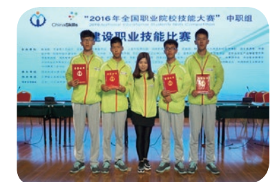
2016年全国职业院校技能大赛： 工程测量二等奖