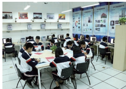
建筑工程造价专业

学生毕业后能够在工程（造价）咨询公司、建筑施工企业、建筑装潢装饰工程公司、工程建设监理公司、房地产开发企业、设计院、会计审计事务所、政府部门企事业单位基建部门（甲方）等单位，从事工程造价招标代理、建设项目投融资和投资控制、工程造价控制、投标报价决策、合同管理、工程预决算、工程成本分析、工程咨询、工程监理以及工程造价管理相关软件的开发应用和技术支持等工作。