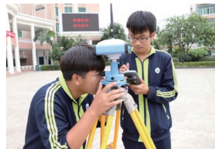
建筑工程施工专业

本专业主要面向建筑工程施工企业、市政工程施工企业和工程监理企业等工程建设单位，培养从事建筑工程施工管理、建筑工程质量与材料检测、工程量概预算、建筑工程质量与安全管理等工作的高素质技能人才。