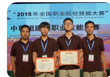
2015年全国、福建省职业院校技能大赛： 楼宇智能化项目二等奖