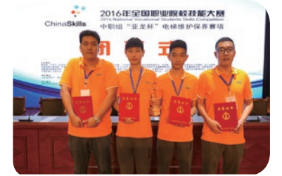
2016年全国职业院校技能大赛： 电梯维修保养一等奖