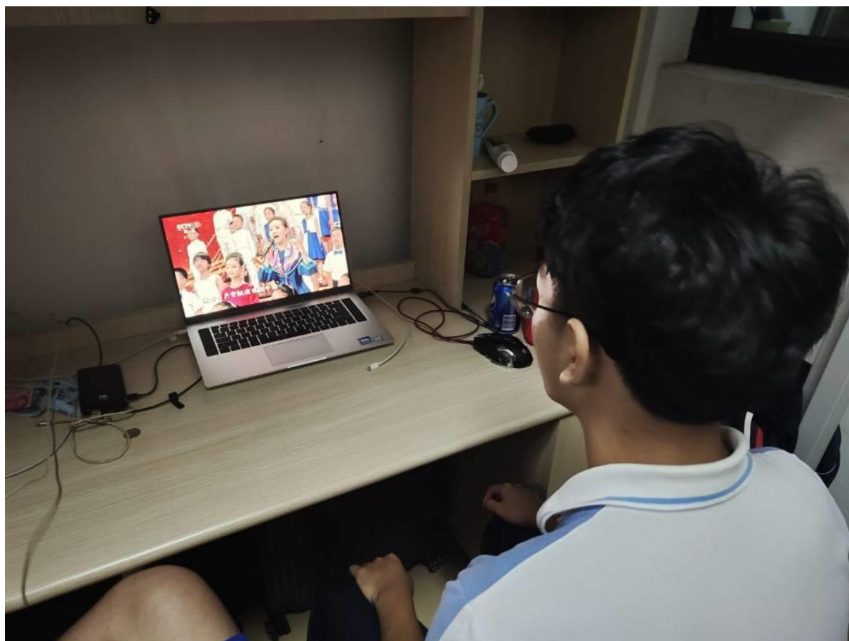
学生在家观看《开学第一课》