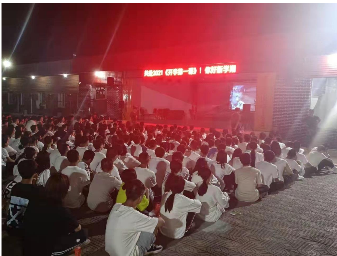
2021级学生在社会实践基地观看《开学第一课》