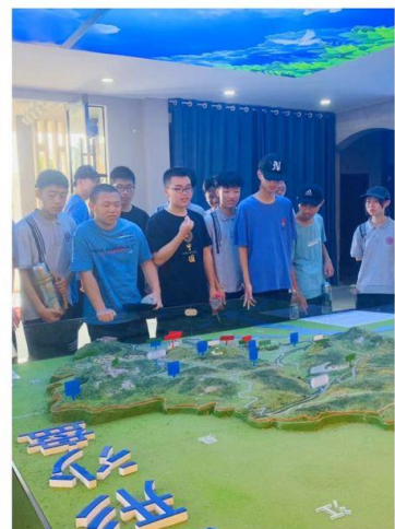
(参观法制教育基地)