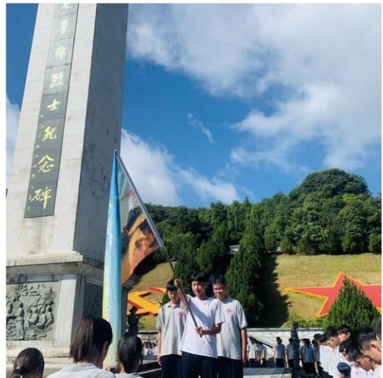
(参观“八·一七烈士陵园”)