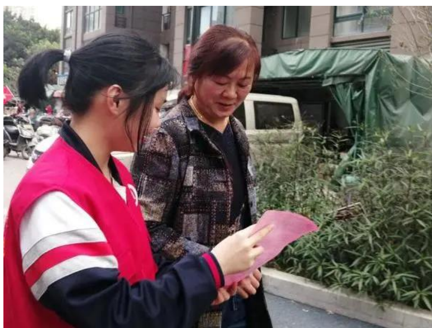
志愿者正在向社区居民宣传节水知识