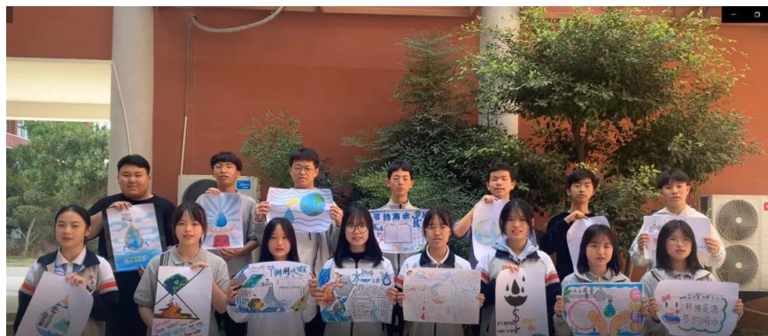
同学们绘制节水爱水护水手抄报