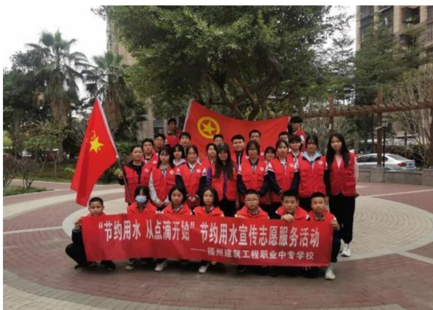
参加节约用水宣传下社区志愿服务的老师同学们