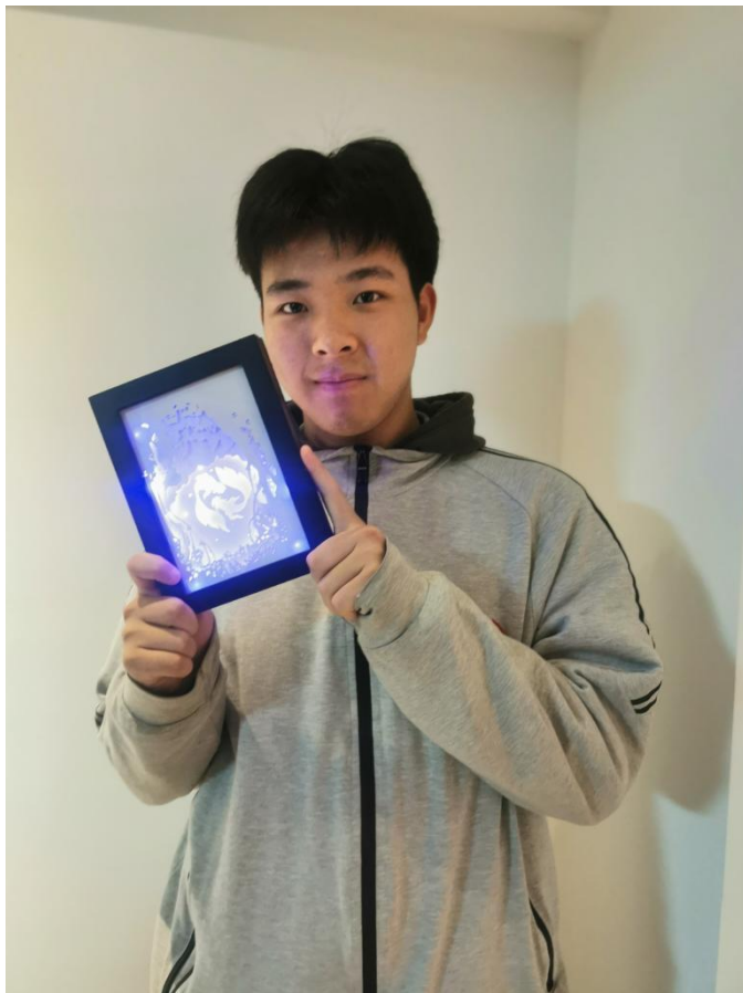
团员青年设计制作花灯